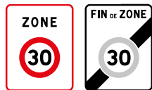
ZONE 30 : DÉBUT ET FIN