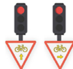
TOUT DROIT OU TOURNE-À-DROITE : AUTORISATION DE DÉPASSER LE FEU ROUGE, EN CÉDANT LE PASSAGE AUX PIÉTONS ET AUX VÉHICULES QUI BÉNÉFICIENT DU FEU VERT